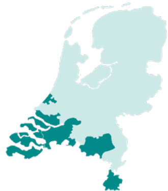
■ Regio's CZ zorgkantoor

U kunt voor zorg terecht bij verschillende instanties: uw zorgverzekeraar, een zorgkantoor of gemeente. Zoekt u ondersteuning of wilt u weten hoe u de zorg kunt regelen voor u zelf of iemand anders? Ga naar: www.cz-zorgkantoor.nl/hulpwijzer-wlz en ontvang een persoonlijk stappenplan en tips.