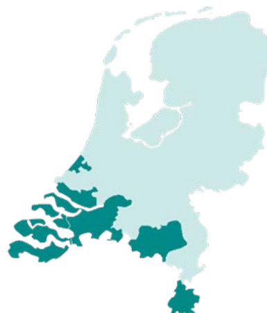
■ Regio's CZ zorgkantoor

of iemand anders? Ga naar: www.cz-zorgkantoor.nl/hulpwijzer en ontvang een persoonlijk stappenplan en tips.