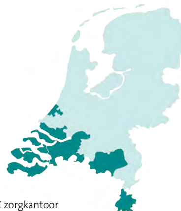
■ Regio's CZ zorgkantoor

U kunt voor zorg terecht bij verschillende instanties: uw zorgverzekeraar, een zorgkantoor of gemeente. Zoekt u ondersteuning of wilt u weten hoe u de zorg kunt regelen voor u zelf of iemand anders? Ga naar: www.cz.nl/zorgkantoor/hulpwijzer en ontvang een persoonlijk stappenplan en tips.